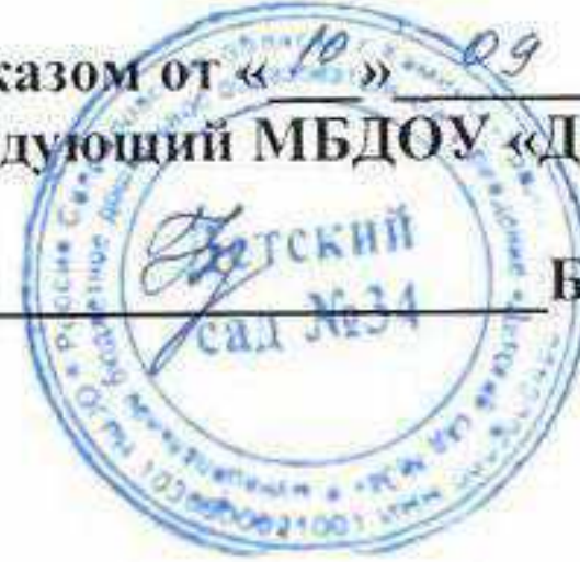
График сменности работников муниципального бюджетного дошкольного образовательного учреждения «Детский сад № 34»